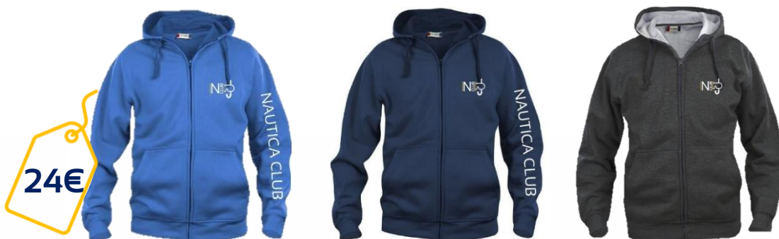
Bleu Royal ou Navy ou Gris - Broderie cœur

Unisex, tissu doux, Smartphone system (XS au 3XL - 65% polyester – 35% coton)