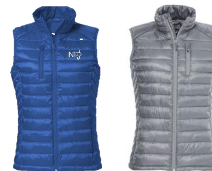
Bleu Royal ou Navy ou Gris - Broderie cœur