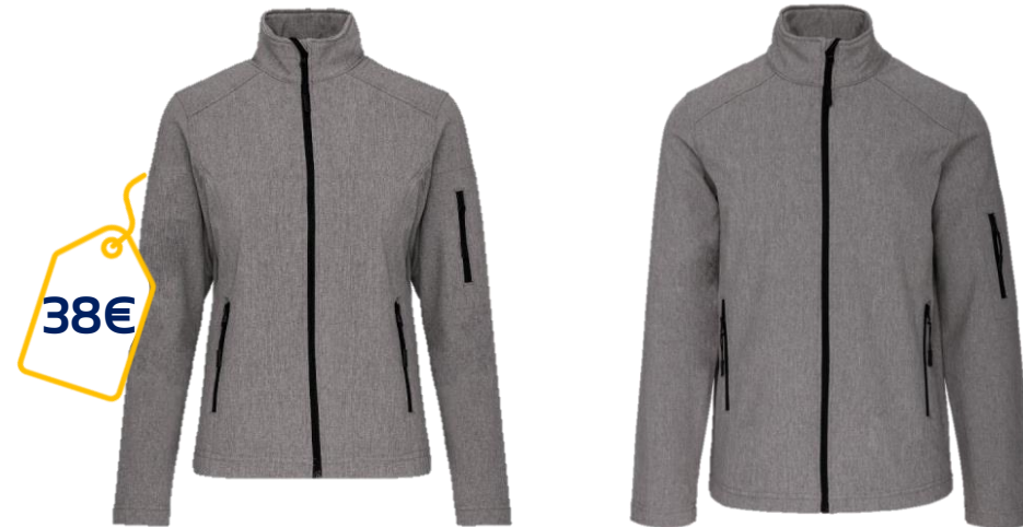
Couleur Marl Grey - Broderie cœur