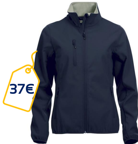
Bleu Navy - Broderie cœur

Polo Basic, Homme/Femme 3 couches, col doublé, bandes élastiques aux poignets et à la taille (XS au 2XL).