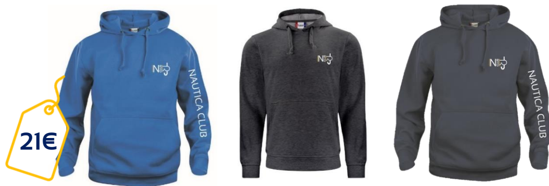
Bleu Royal ou Navy ou Gris - Broderie cœur

Unisex, tissu doux, cordon de serrage et poche kangourou, Smartphone system. Tissu doux et stabilisé adapté aux lavages intensifs. (XS au 3XL - 65% polyester 35% coton)